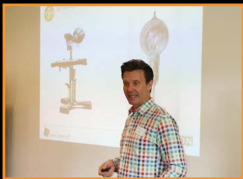
Impulsvortrag im Workshop